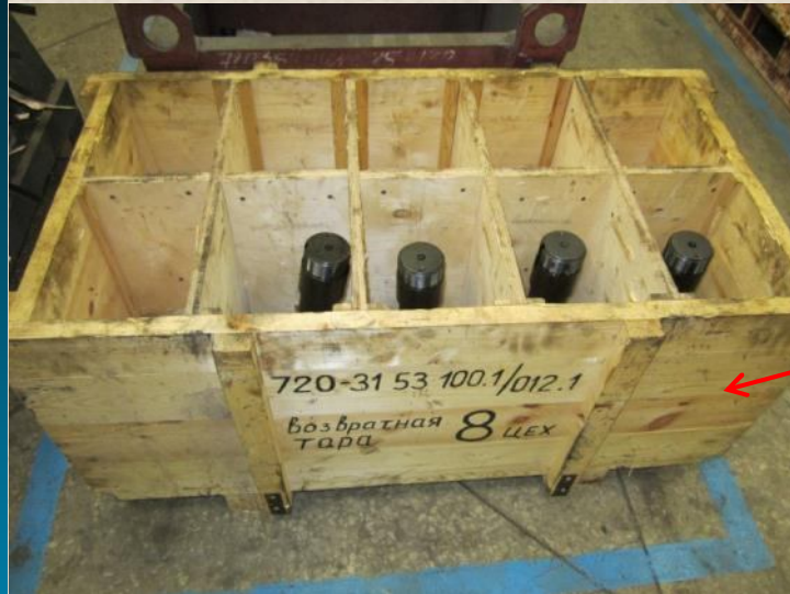
MBM (317 цех)