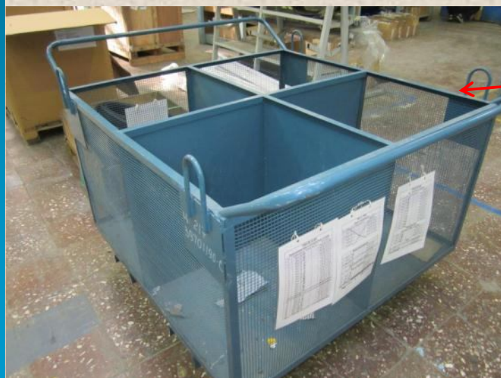
MBM (217 цех)