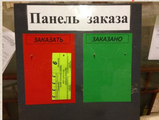
МВМ (317цех) Панель заказа комплектующих