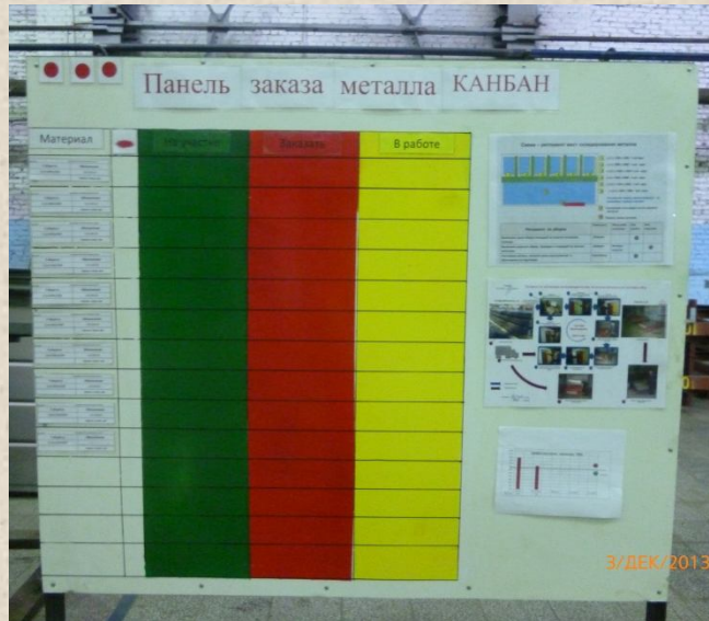
МВМ (317цех) Панель заказа комплектующих